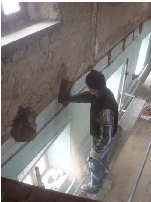
Travaux dans la mairie